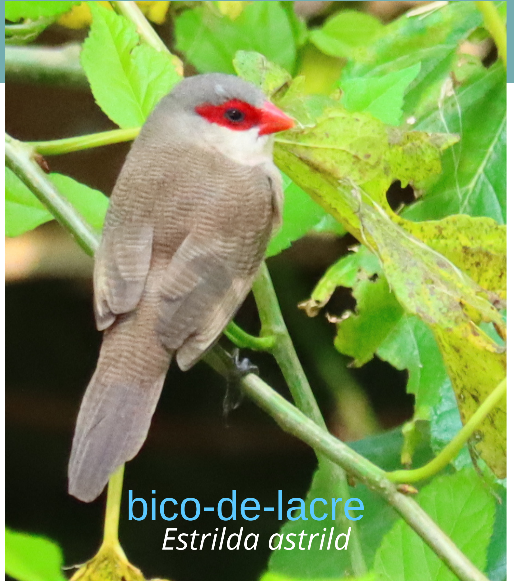
bico-de-lacre Estrilda astrild

23 – Aniversário da Cidade (Campus de Florianópolis)