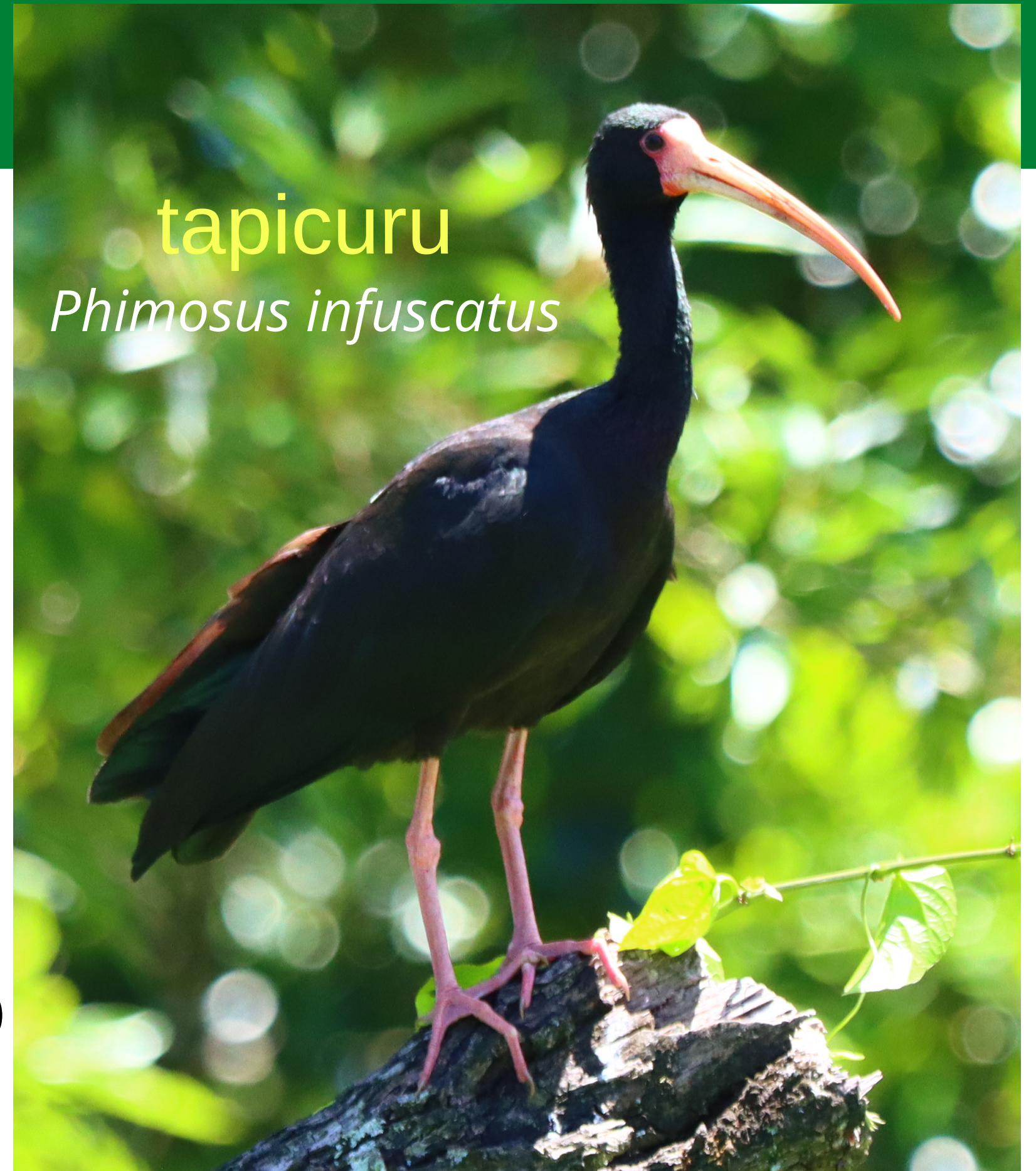
tapicuru Phimosus infuscatus

04 – Dia da Padroeira da Cidade (Campus de Araranguá)