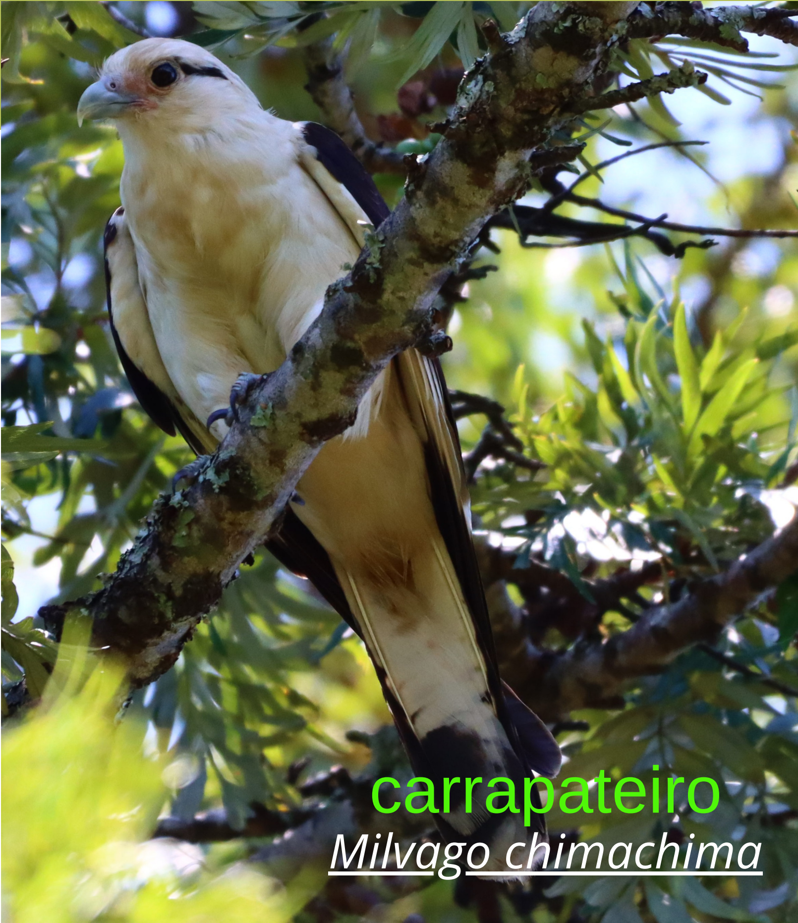
carrapateiro Milvago chimachima