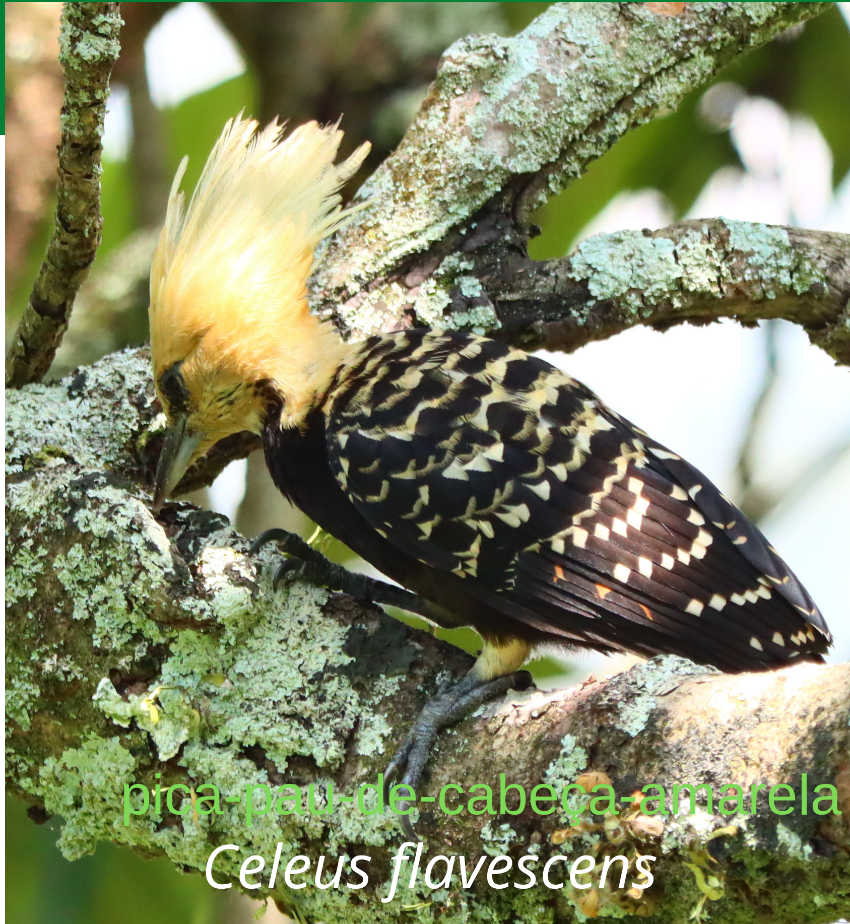
pica-pau-de-cabeça-amarela Celeus flavescens