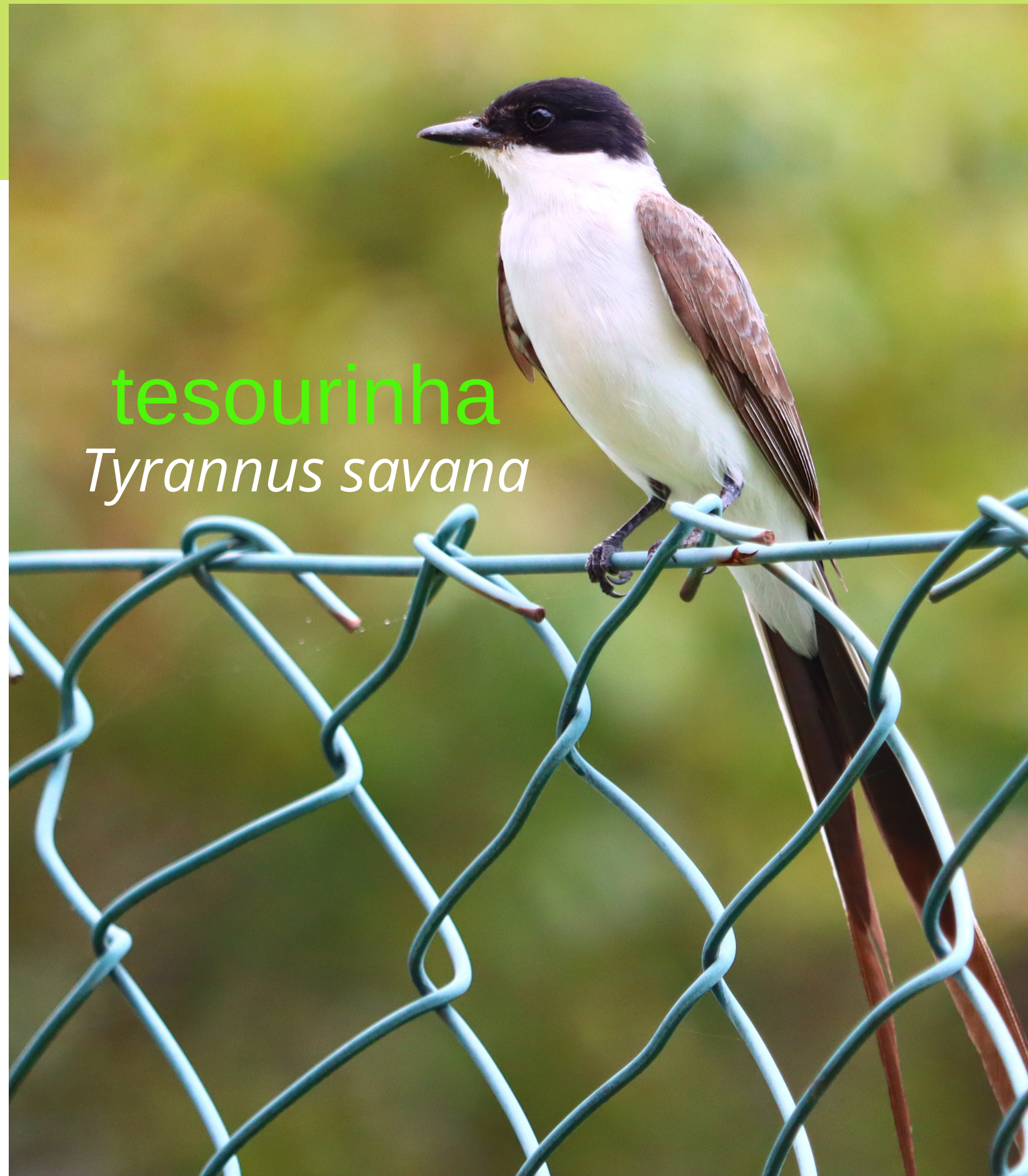
tesourinha Tyrannus savana