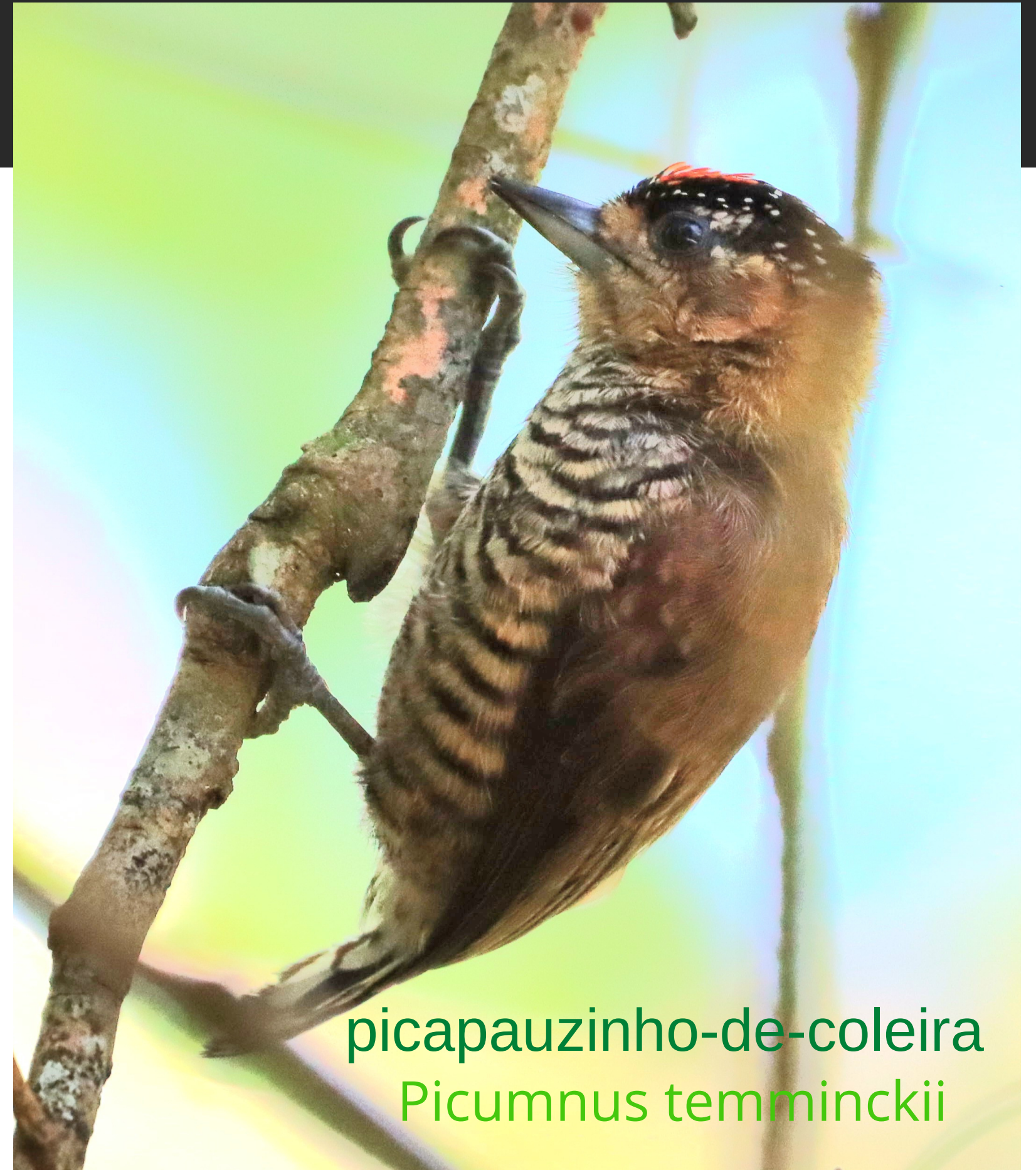
picapauzinho-de-coleira Picumnus temminckii