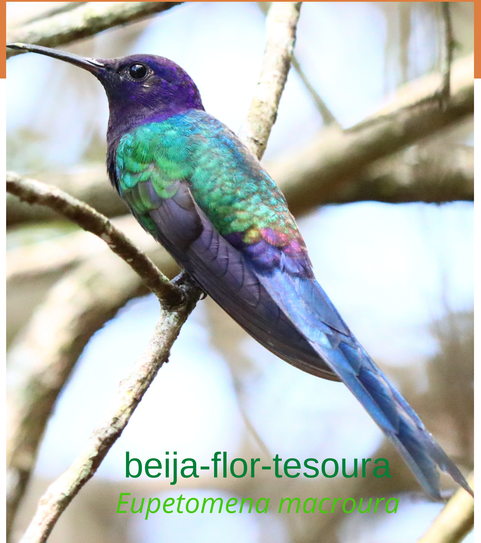
beija-flor-tesoura Eupetomena macroura