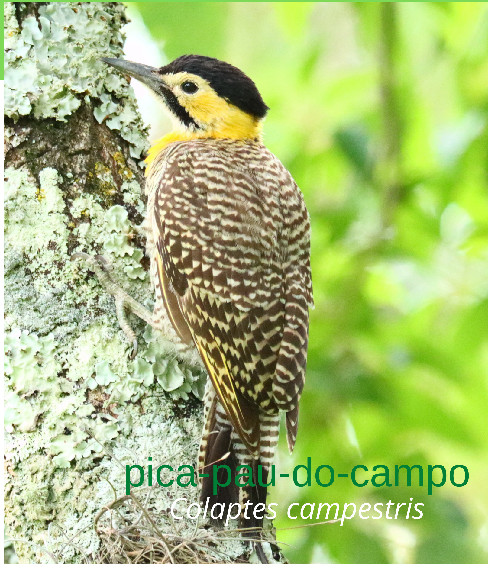
pica-pau-do-campo Colaptes campestris