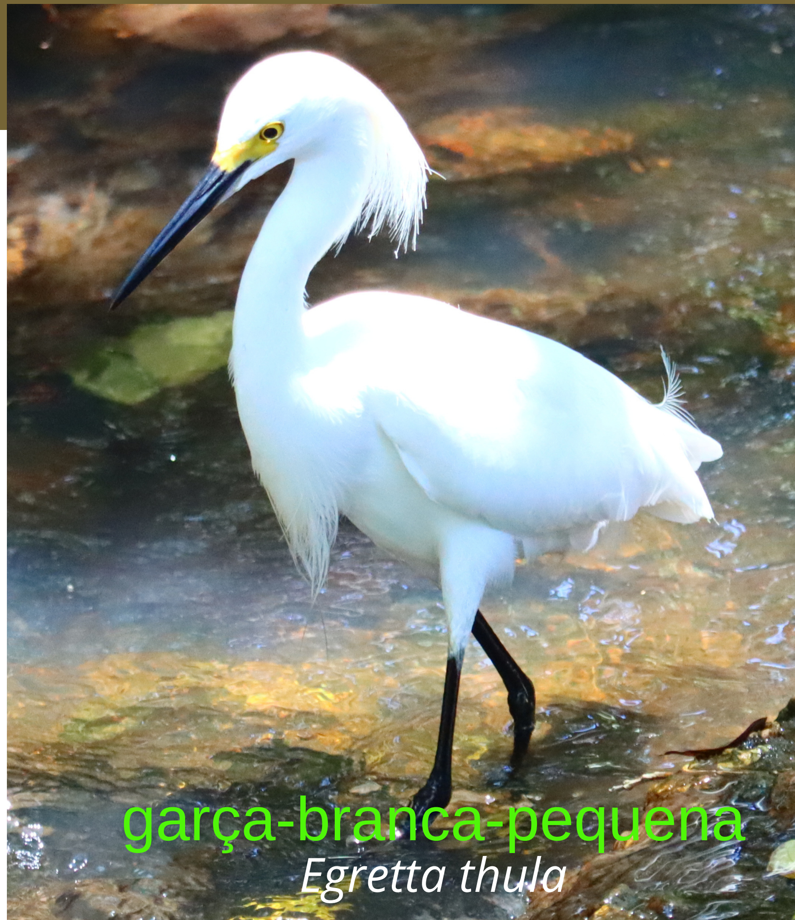
garça-branca-pequena Egretta thula