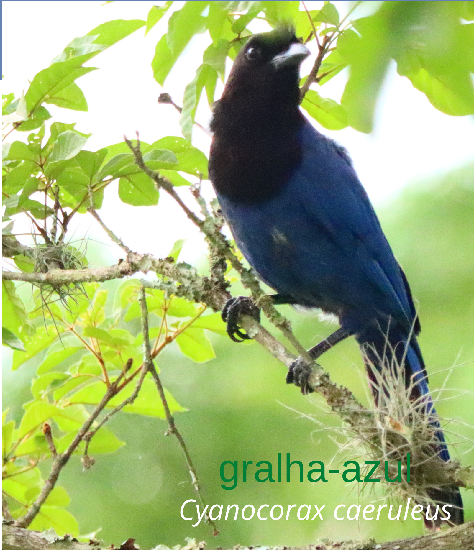
gralha-azul Cyanocorax caeruleus