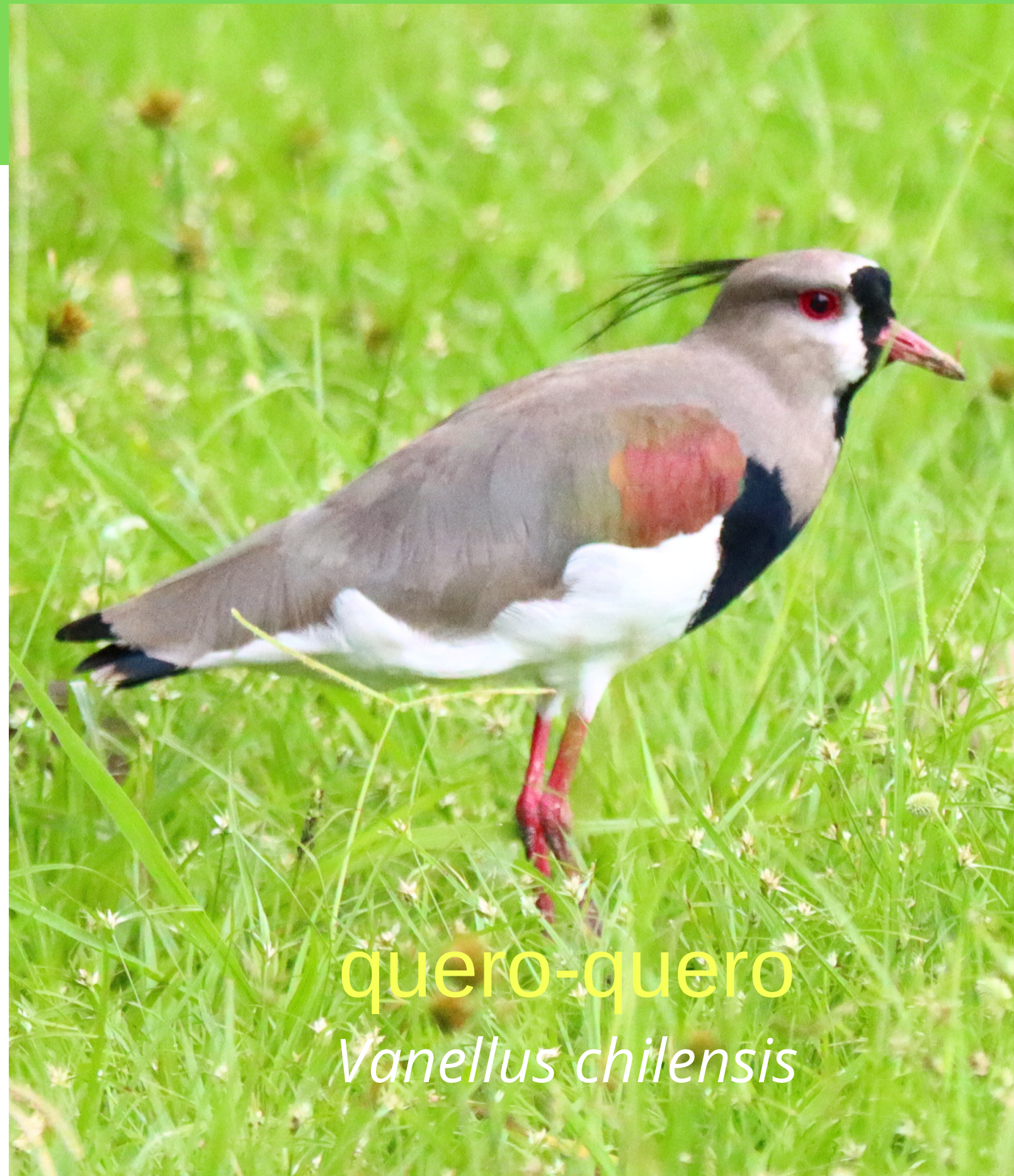
quero-quero Vanellus chilensis